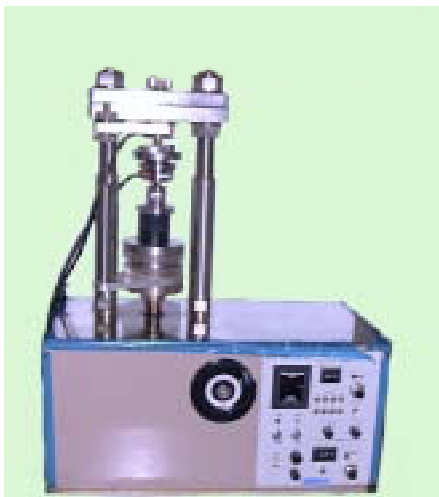
試験機に取り付けたままのセンサー